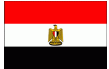
(エジプト・アラブ共和国の国旗)

エジプト は北アフリカの北東部に位置し、世界最古文明の一つ「古代エジプト文明」が栄えた国です。正式名称はエジプト・アラブ共和国。面積は日本の3倍弱の約100万km 2 、人口は9,338万人(2016年)。国土の9割が砂漠で、東部を南北に貫くナイル川流域およびスエズ運河沿いに住民が集中しています。住民はアラブ民族が多数を占め、9割以上がイスラム教徒です。ナイル川流域には現在も数多くの古代遺跡が残されていて、その栄光を今に伝えています。