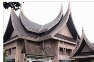
(ミナンカバウ式建築)

マレーシア は、東南アジアの連邦制立憲君主国です。マレー半島の大半とボルネオ島北西部を併せた国土から成り立っています。国土面積は約33万km 2 で、その約60%が熱帯雨林に覆われています。人口は3,170万人(2016年)。イスラム教を信仰するマレー民族が大多数を占めていますが、中華系、インド系、そして様々な先住民族は、それぞれの民族が持つ言語や宗教、生活習慣などの文化と伝統を守りながら暮らしを営んでいます。